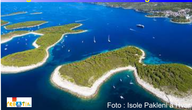
Foto : Isole Pakleni a Hvar